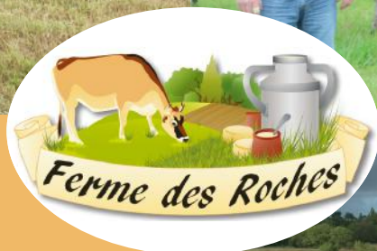
Ghislain, installé depuis 2010